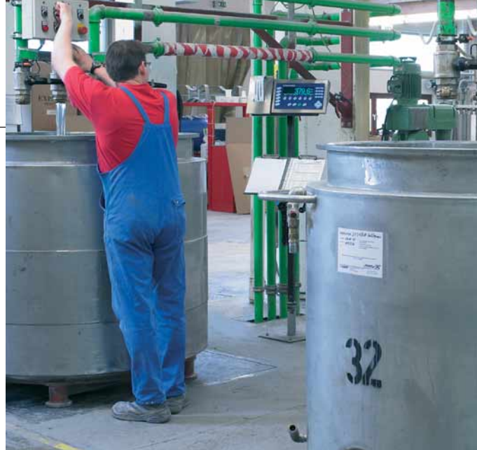
Alimentación automática o semiautomática

Solo tiene que introducir los pesos finales deseados e IND690fill calculará por sí mismo los puntos de desconexión. La formulación será precisa incluso desde la primera fórmula, lo que le evitará pérdidas de tiempo y material.