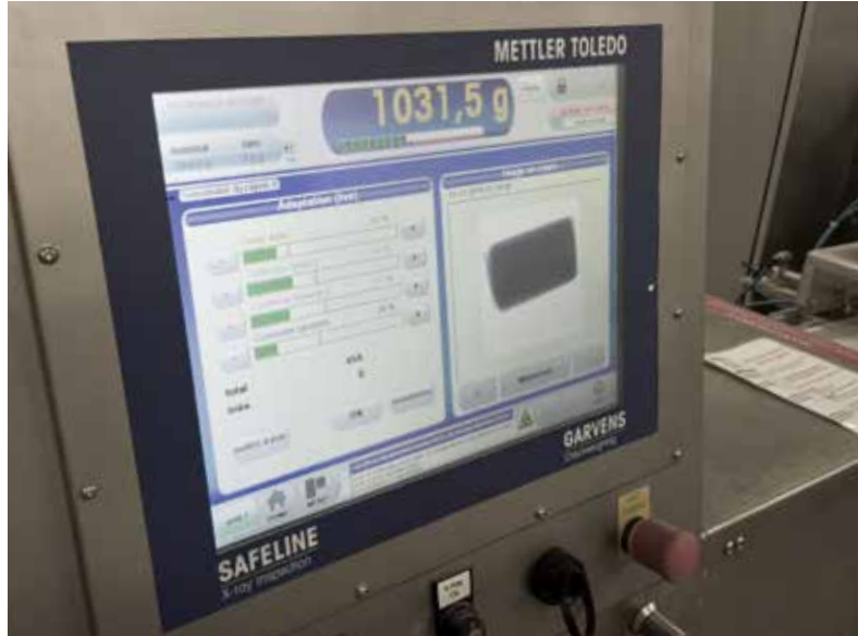
Kombinasyon sisteminin yazılım kullanıcı arayüzü, hem tartım hem de X-ray denetim sonuçlarını gösterir.

Dinamik kontrol terazileri, Avrupa hazır ambalajlı ürün yönetmeliklerine göre bütün ürünlerin tartılmasını otomatik olarak sağlar. Kirlilik tespit edilen ürünler gibi yeterince doldurulmamış ve yönetmeliğe uygun olmayan ürünler de anında reddedilir. Üretim hatlarında, çeşitli ürünler için farklı paketleme türleri kullanılır. Ürün denetim ekipmanının sezgisel yazılım arayüzü ve ürün ön ayarları için büyük hafızası sayesinde, ürün aktarımları zaman kaybetmeden gerçekleştirilebilir. Diğer kullanışlı özelliklerin arasında bu özellik, hat operatörüne zaman kazandırır ve paketleme hatlarının Toplam Ekipman Verimliliği'ni (OEE) artırır. Bununla beraber sayısız mekanik seçenek, her tür paketlemenin yapılması ve izlenmesi