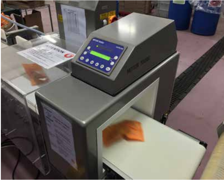
Hattlarda, kurulu kritik kontrol noktaları (CCP) IFS kılavuzuna göre ürün güvenliğini sağlamak için metal kirliliğine karşı bütün paketleri kontrol eder.

müşteriler ve tüketiciler ürünlerinin kirlilikten muaf olduğuna ve belirlenen ağırlıklarının doğru olduğuna emin olabilirler.