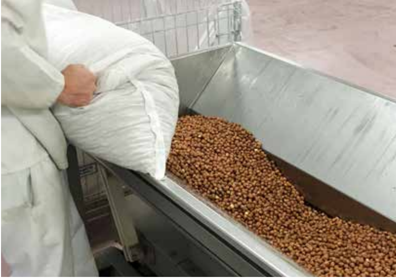
Birçok durumda hammadde doğrudan yetiştirildiği yerden teslim edilir.