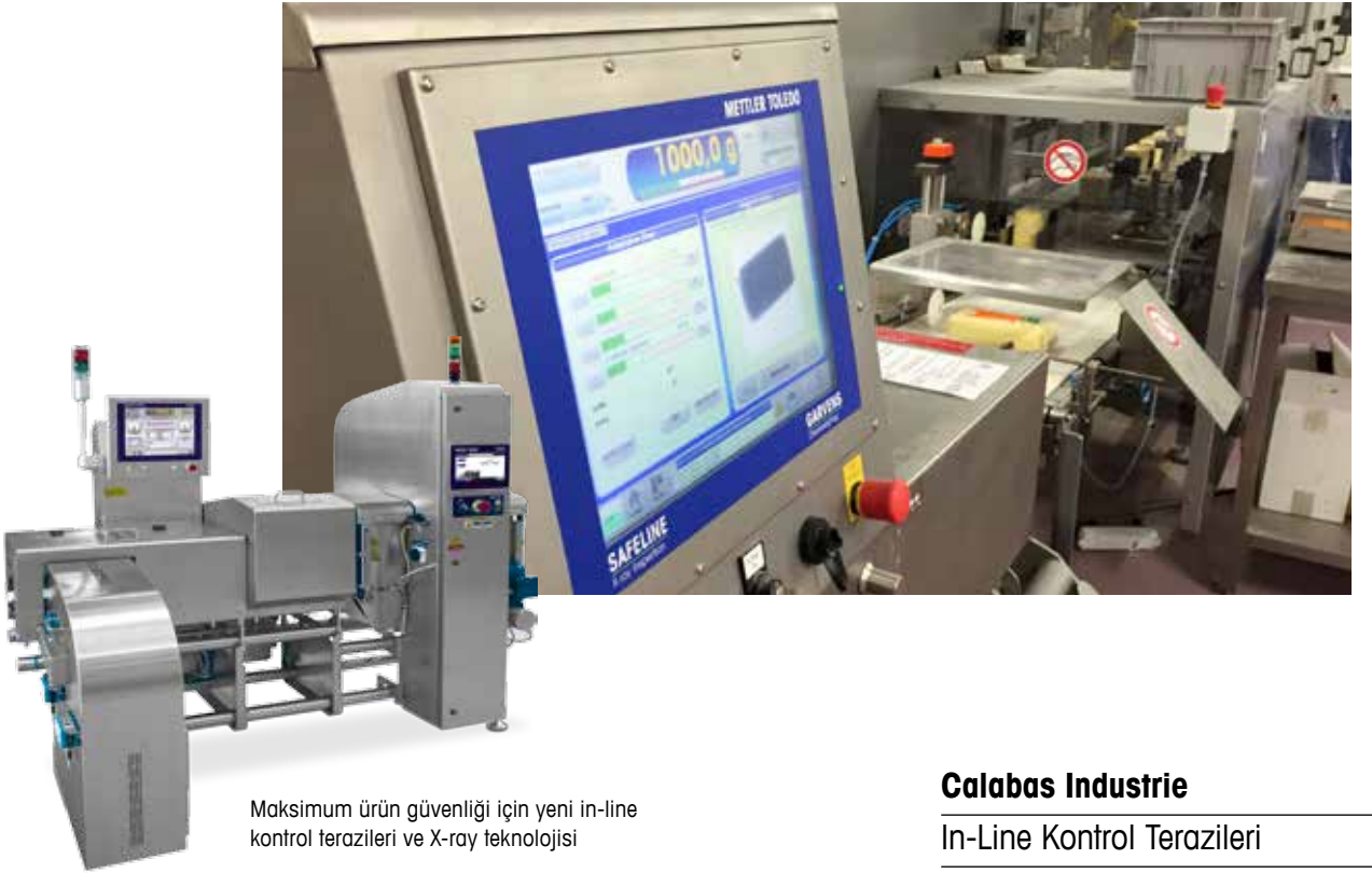
Maksimum ürün güvenliği için yeni in-line kontrol terazileri ve X-ray teknolojisi

Lojistik, depolama ve özellikle kuru meyve ile sebzelerin anlaşılabilir olarak paketlenmesinde uzmanlaşan Fransız şirket Calabas Industrie 2010 yılında kuruldu. O zamandan beri değerli müşterilerinin güvenini kazanmayı başardı. Şirket güvenilir, hijyenik, emniyetli prosesler ve ürünlerin yanı sıra, kalite de sağlamaya devam ediyor. Avrupa tamamlanmış paketleme yönetmeliklerine göre,